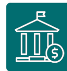
بانک و بیمه