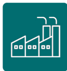
تولید کارخانه ای

نتیجه این همراهی و مشارکت، ایجاد برخی از بزرگ‌ترین پروژه‌های نرم‌افزاری کشور در طیف وسیعی از سازمان‌ها بوده است که در منابع مهم کشور حضور دارند. تنوع این کسب و کارها به گونه‌ای است که خوشبختانه اعتماد و اطمینان بالایی را برای استفاده از زیرساخت سیستم‌ساز برسا در مشتریان جدید بوجود آورده است.