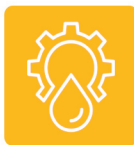
نفت و گاز و پتروشیمی